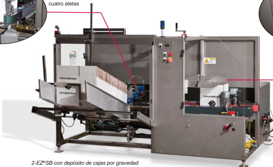
2-EZ ® SB con depósito de cajas por gravedad