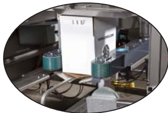
Cerramiento positivo de las cuatro aletas