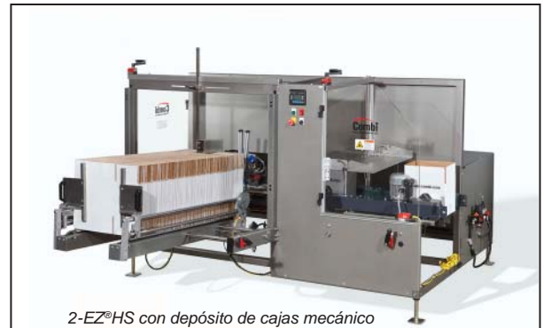
2-EZ ® HS con depósito de cajas mecánico

Los equipos Combi 2-EZ ® HS, 2-EZ ® SB y 2-EZ ® SB Plus pueden formar y sellar una amplia gama de tamaños y estilos de cajas.