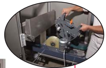
Placa de sujeción con bisagras