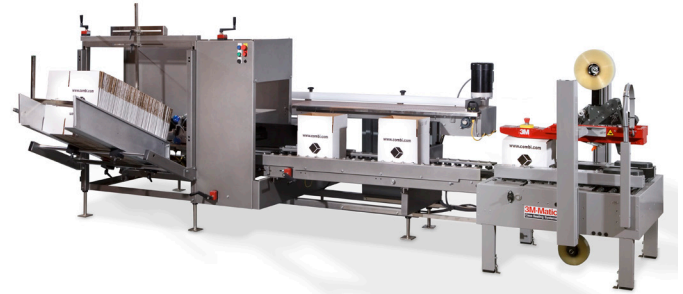
ERGOMATIC CON SELLADORA 3M-MATIC™ A80