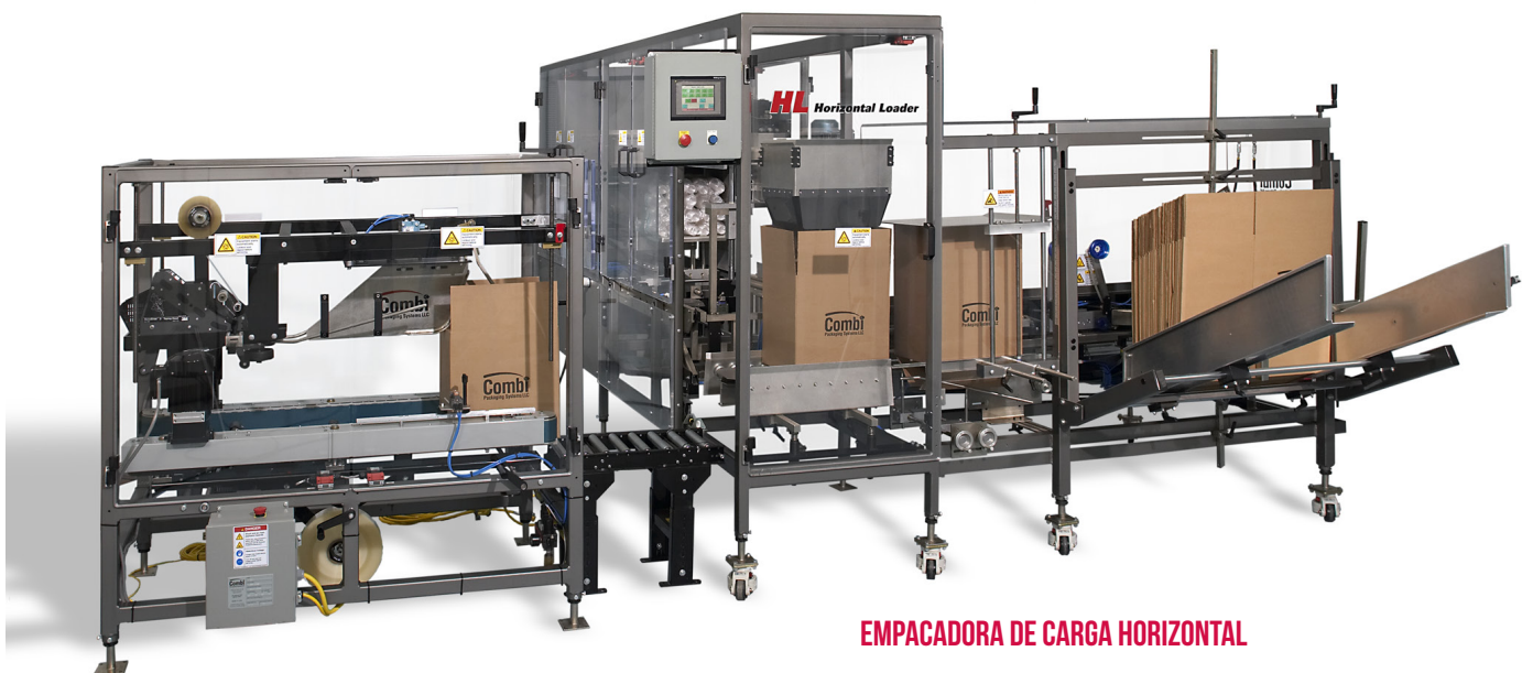
EMPACADORA DE CARGA HORIZONTAL